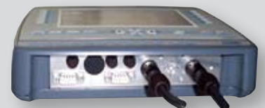
field-operator 310 . Schnittstellen