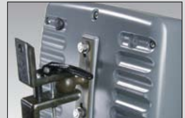
field-operator 310 . Rückansicht